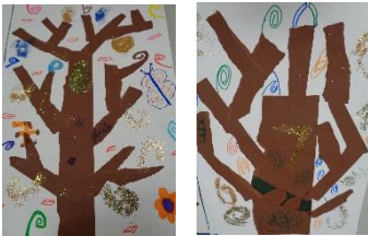
Inspiratie naar de levensboom van Gustav Klimt