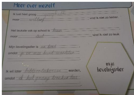
Uit het 'ik tijdschrift'